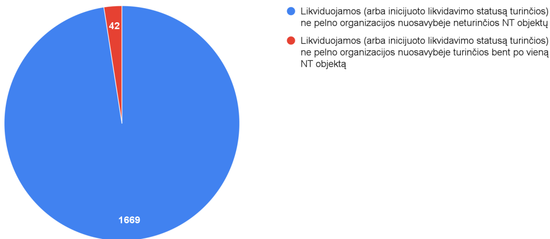
Pav. 3. Nekilnojamojo turto nuosavybės teises turinčių likviduojamų (arba inicijuoto likvidavimo statusą turinčių) ne pelno organizacijų skaičius, 2024 m. liepos mėn. duomenys

2024 m. liepos mėn. Registrų centro duomenimis iš visų likviduojamų arba inicijuoto likvidavimo statusą turinčių ne pelno siekiančių organizacijų, 42 organizacijos nuosavybėje turi bent po vieną nekilnojamojo turto objektą.