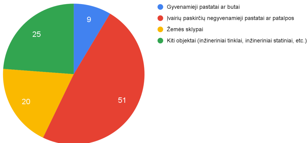
Pav. 4. Ne pelno siekiančių organizacijų nuosavybėje esančio nekilnojamojo turto vienetai pagal tipą, 2024 m. liepos mėn. duomenys

Iš viso šios organizacijos turi 105 nekilnojamojo turto objektus: 9 gyvenamuosius pastatus ar butus, 51 įvairių paskirčių negyvenamąjį pastatą ar patalpą, 20 žemės sklypų ir 25 kt. objektus (inžineriniai tinklai, inžineriniai statiniai, ir kt.). Daugeliu atveju organizacija nekilnojamąjį objektą valdo visą, bet esama atvejų kai organizacijos nuosavybėje yra tik pusė ar nedidelė dalis nekilnojamojo turto objekto.