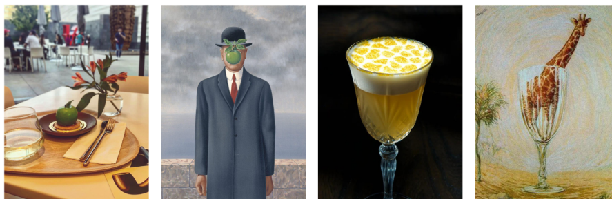
Pav. 2. René Magritte parodos paveiksai bei „SFMOMA” kavinės siūlomų valgių ir gėrimų nuotraukos

Muziejų parduotuvės tiek užsienyje, tiek Lietuvoje, yra jau gana įprastas būdas pritraukti papildomų lėšų iš muziejų lankytojų. Tačiau, restoranai ar kavinės muziejų patalpose sutinkami kiek rečiau. San Fransisko modernaus meno muziejaus „SFMOMA” viduje įsikūrusi kavinė siūlo ne tik atsipūsti tarp parodų, bet ir pasimėgauti desertais ar patiekalais, įkvėptais tuo metu eksponuojamų meno kūrinių. 2018 metais surengtos René Magritte parodos metu, kavinėje buvo galima pasivaišinti desertu, atkartojančiu garsų menininko darbą „ Le fils de l'homme ”. Taip pat, buvo siūloma atsigaivinti ir kokteilium, įkvėptu kitu šio dailininko paveikslu „ Le bain de cristal ”. 54 Įsigydami specialiai parodai sukurtus valgius ir gėrimus muziejaus kavinėje, lankytojai buvo informuojami, jog dalis sumos bus skiriama muziejaus veiklai vystyti.