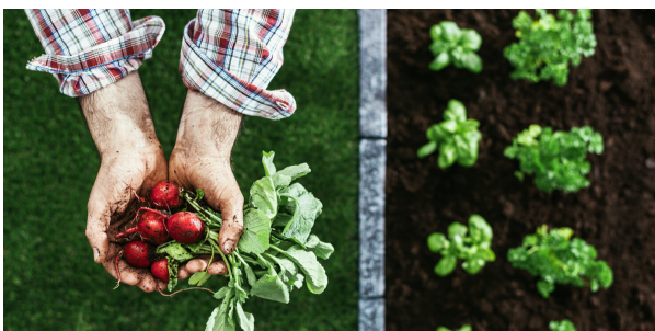
AKIS Stimulating creativity and learning, 2018

Įvairios veiklos, tokios kaip lauko dienos, mokymosi sesijos, vizitai ūkiuose, dirbtuvės ir ūkininkų susitikimai, buvo organizuojami siekiant sustiprinti geresnį žinių perdavimą tarp ūkių ir paskatinti kooperaciją tarp tradicinių ir ekologinių ūkių.