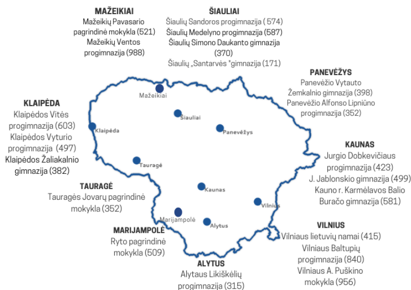
Pav. 10 Lietuvos savivaldybių identifiukuotos mokyklos, su kuriomis atliekama viešoji konsultacija