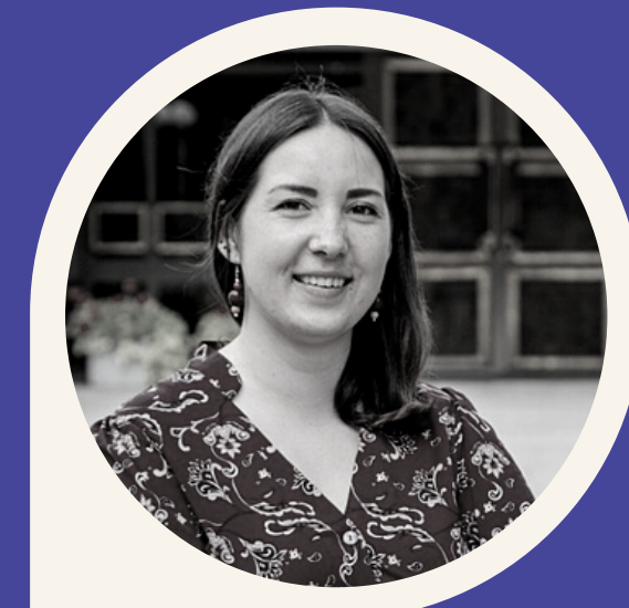
„Kurk Lietuvai“ ir Švietimo, mokslo ir sporto ministerijos vykdomo projekto „STEAM regioninio bendradarbiavimo stiprinimas“ vadovai