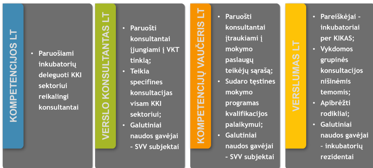
5. KKI paramos modelis pagal esamas LR Ūkio ministerijos priemones.