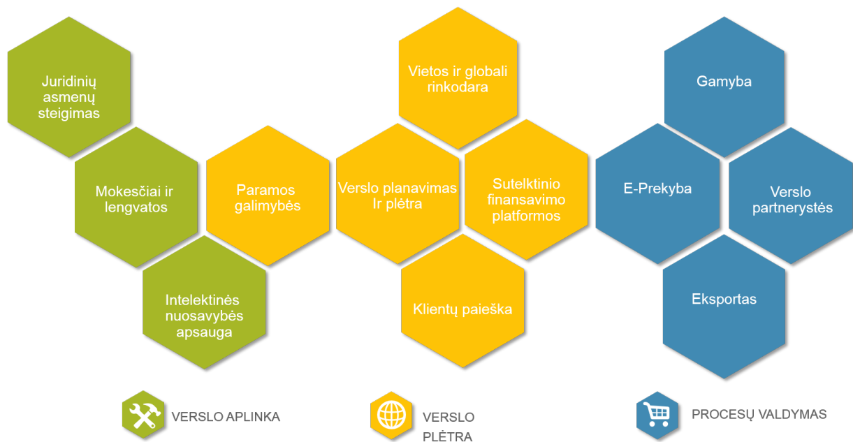
3. Trūkstančių KKI kompetencijų žemėlapis

Toliau pateikiami siūlymai galimam esamų LR Ūkio ministerijos priemonių tobulinimui bei efektyvesniam kitų resursų, kaip, pvz., inkubatorių, „Versli Lietuva“ įrankių, panaudojimui KKI sektoriui skatinti. Kaip minėta ankstesniame skyriuje, kalbant apie paramos priemones, iškilą ir jų komunikacijos problema. Dažnai KKI sektorius nežino, jog gali pasinaudoti parama, nes nepriskiria savęs prie verslo subjektų. Tinkama komunikacija padėtų pasiekti daugiau galimų pareiškėjų ir formuotų KKI kaip lygiaverčių verslų įvaizdį. Įvertinus KKI verslų turimą potencialą bei sudėtingas sąlygas jam atskleisti, labai svarbu įvardinti svarbiausius įgūdžius, kurie būtini dabar, o ypač ateityje. Paramos KKI sektoriui priemonės turėtų būti nukreiptos į tarpsektorinį bendradarbiavimą, įtraukiant kitų sričių specialistus su būtinomis kompetencijomis ir išnaudojant jų gebėjimus bei turimas žinias. Šiuo tikslu siūloma speciali programa, galinti išnaudoti jau esamas Ūkio ministerijos paramos priemones ir egzistuojančią meno inkubatorių Lietuvoje ekosistemą.