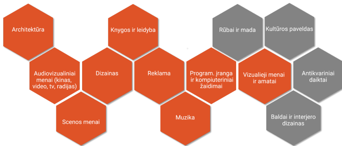
1. KKI apibrėžimas Lietuvoje.