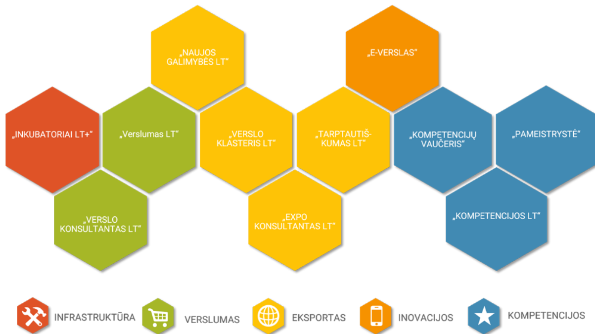
2. LR Ūkio ministerijos konkurencingumo skatinimo priemonės

Toliau bus apžvelgiamos esamos 2014 – 2020 Europos Sąjungos investicinių veiksmų programos 3 ir 9 prioritetai bei aktualiausios KKI paramos priemonės. Atlikus viešąsias konsultacijas su LR Ūkio ministerijos struktūrinių fondų atstovais ir „Verslios Lietuvos“ darbuotojais, administruojančiais esamas ES paramos verslui priemones, šie prioritetai buvo pasirinkti atsižvelgiant į galimybes pritaikyti juos specifiniams KKI poreikiams.